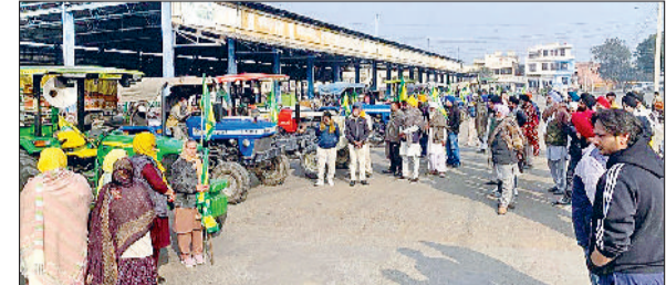
गुहला चीका। ट्रैक्टर मार्च निकलते हुए किसान।