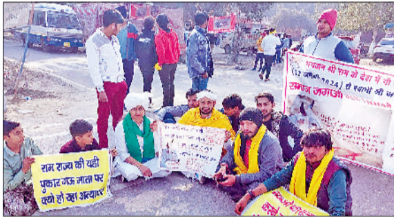
जीद। जाम लगाए गोभक्त।